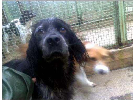
Vispa im canile di Rieti