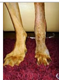
und nach der Operation