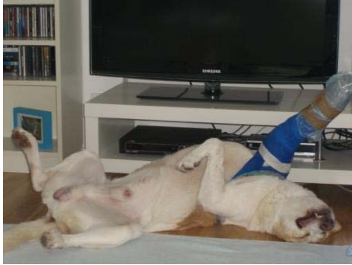
Talismano/Enzo in Deutschland. Mit Gipsbein und ohne Schmerzen ist das Leben schönööön