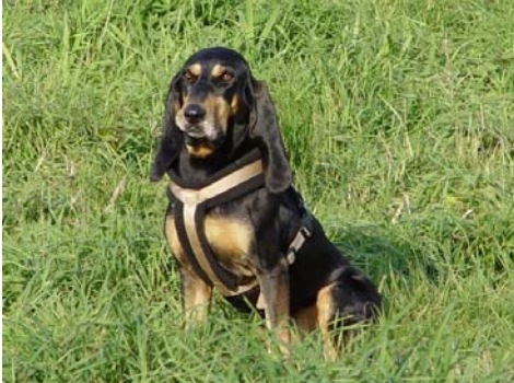
Meo in Deutschland