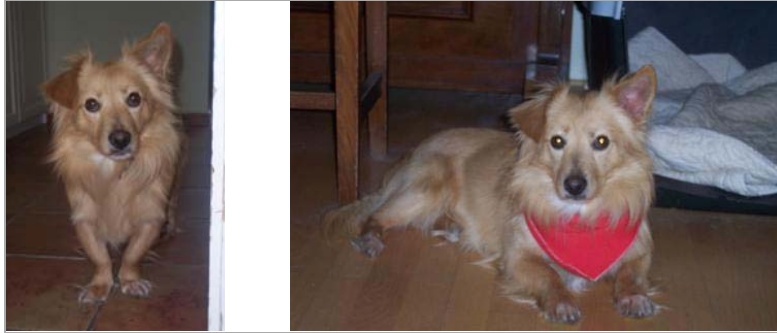
Golia in Deutschland