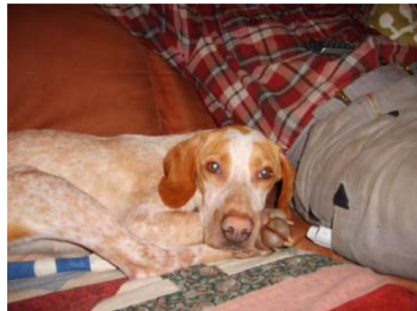
Luce im canile di Rieti