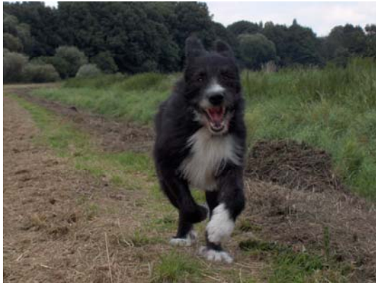
Papillon in Deutschland