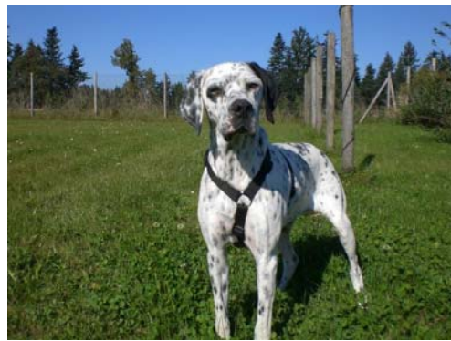
Pierrot in Deutschland