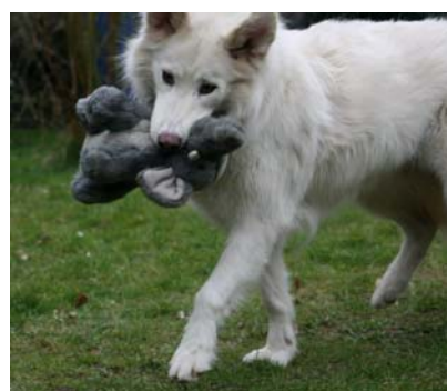
Rosina in Deutschland