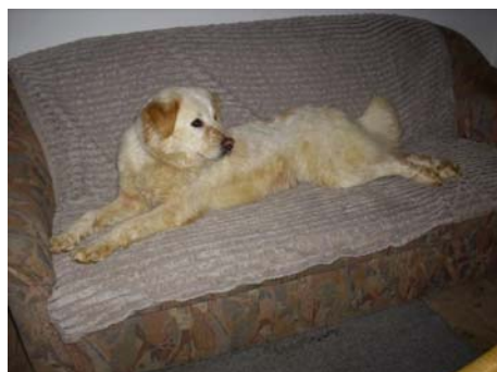
Frolla im canile di Rieti