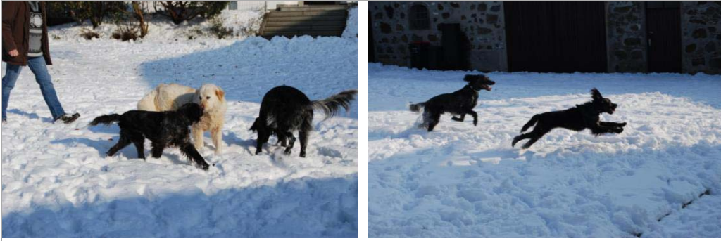
Vispa in Deutschland