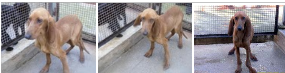
Zoppo im März 2010 im canile di Rieti – nur Haut und Knochen und schwer verletzt