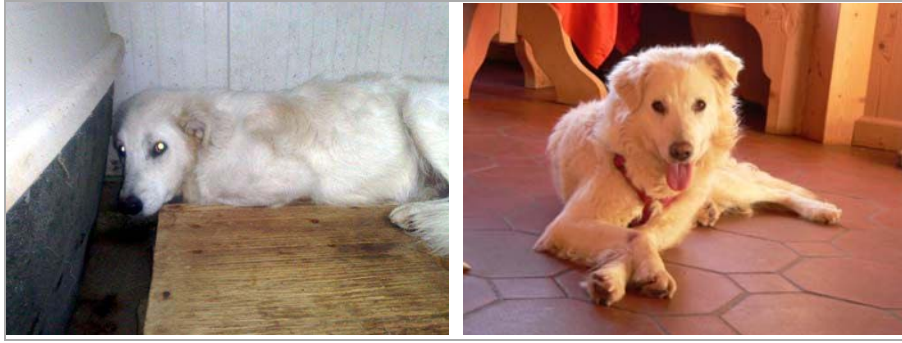
Mars im canile di Rieti – Mars in Deutschland. Sehr gemütlich hier!