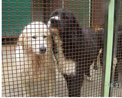
Papillon im canile di Rieti (mit Rosina)