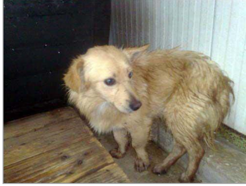
Golia im canile di Rieti