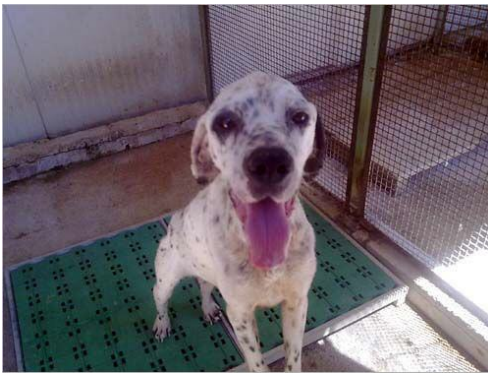
Pierrot im canile di Rieti