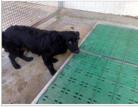
Tappina im canile di Rieti