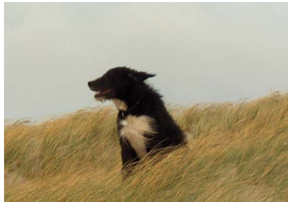
Papillon in Dänemark im Urlaub