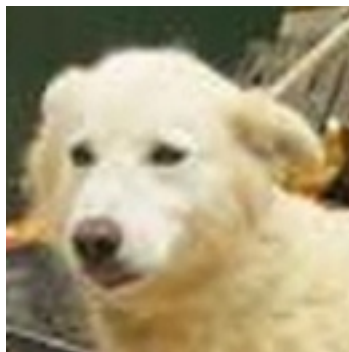
Rosina im caanile di Rieti