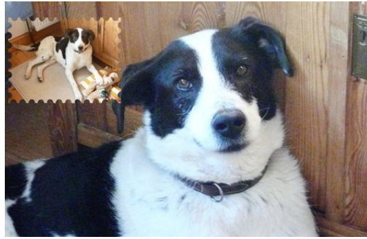
Jumpino im canile di Rieti