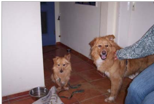
Golia und Orazio zusammen in Deutschland