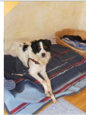
Tato in Deutschland