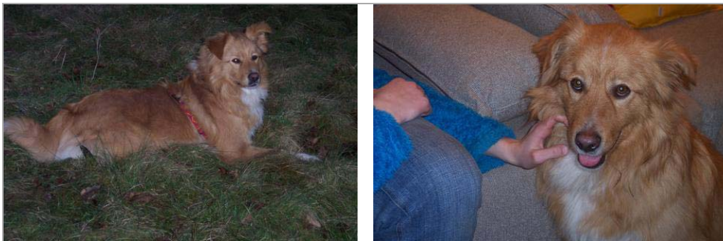
Orazio in Deutschland-