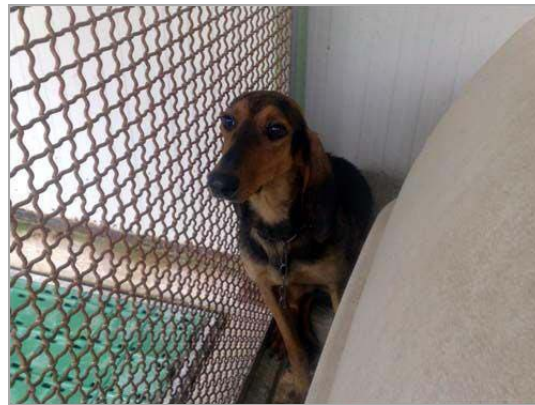
Nella im canile di Rieti