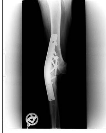
Röntgenaufnahme Talismano/Enzo NACH der Operation

Möchte Frau Galli Pierrot besuchen und ihn fragen ob er lieber im canile di Rieti geblieben wäre?