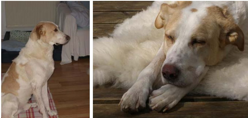
Talismano/Enzo in Deutschland. Der Gips ist weg. Schlafen in der Sonne