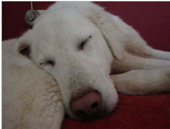
Ob Pupo vom canile di Rieti träumt oder ob er einfach – vergessen – und geniessen will?