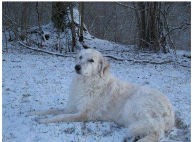
Hier mit Orzorro (auch aus Rieti)