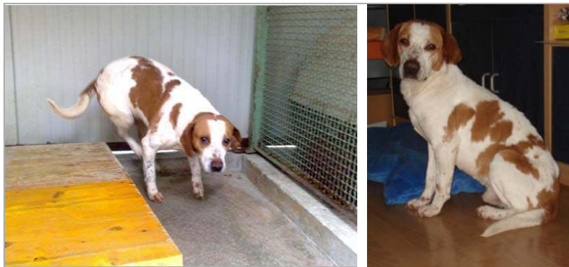
Zeus im canile di Rieti