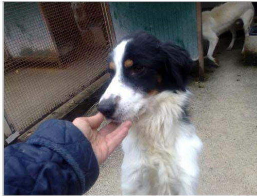
Tato im canile di Rieti