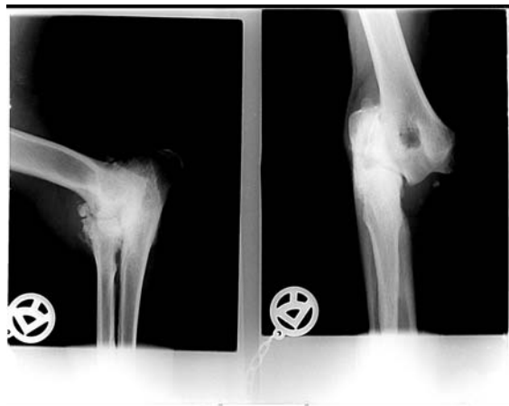
Röntgenaufnahme Talismano/Enzo VOR der Operation