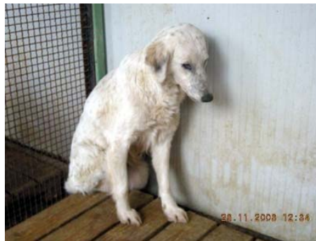
Glenda – sie hat vor Schmerzen geschrien im canile – es hat niemanden interessiert

Hier angekommen, musste sie mehrmals in die Klinik und behandelt werden. Und das ist sie jetzt