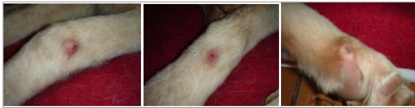
Pupo's Beine bei seiner Ankunft in Deutschland