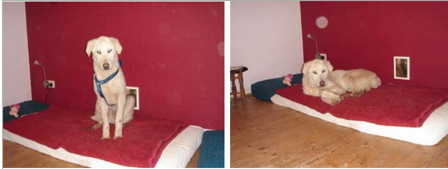
Pupo in Deutschland