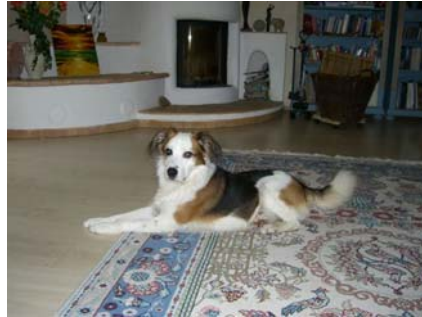
Giove in Deutschland

All diese Hunde aus dem canile di Rieti stehen für viele, viele andere Hunde, denen die Tierschützer aus Italien und Deutschland in ein neues gutes Leben geholfen haben.