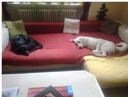
Dalia im canile di Rieti