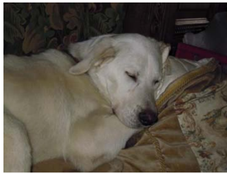
Kia im canile di Rieti