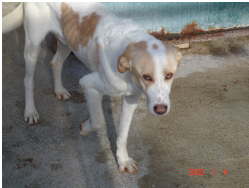
Talismano im canile di Rieti