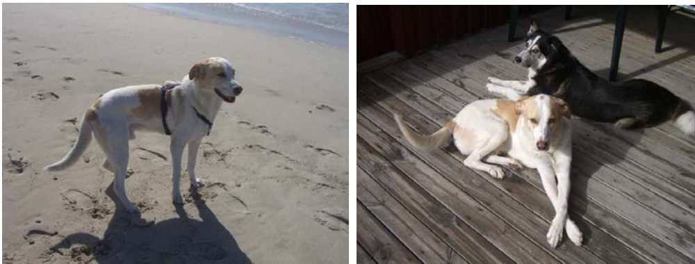
Talismano/Enzo in Dänemark im Urlaub - Talismano/Enzo mit Freund Otis. Ein Ex-Rietiner der ehemals Disparato hieß