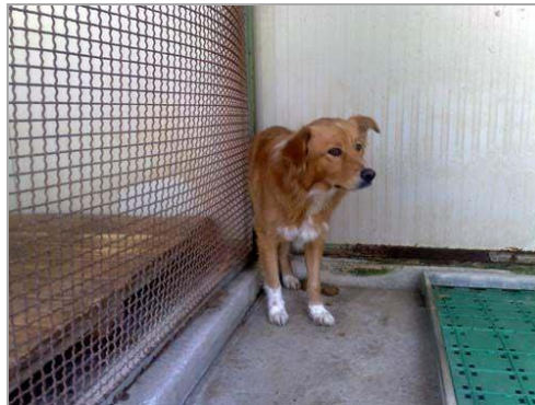
Orazio im canili di Rieti