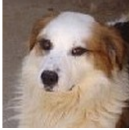
Giove – canile di Rieti