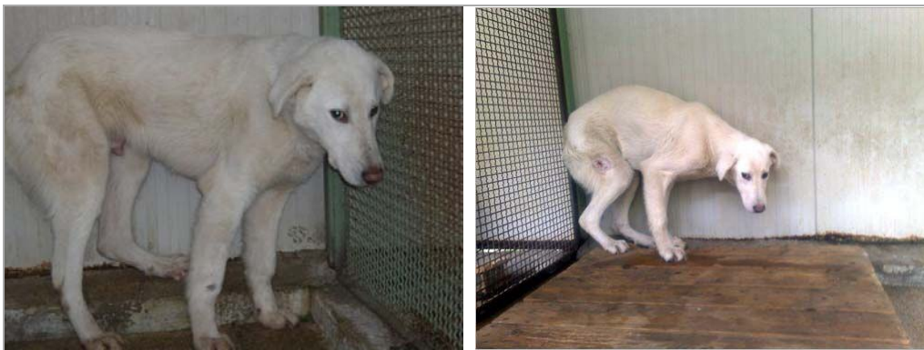
Pupo im canile di Rieti