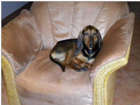
Nella in Deutschland