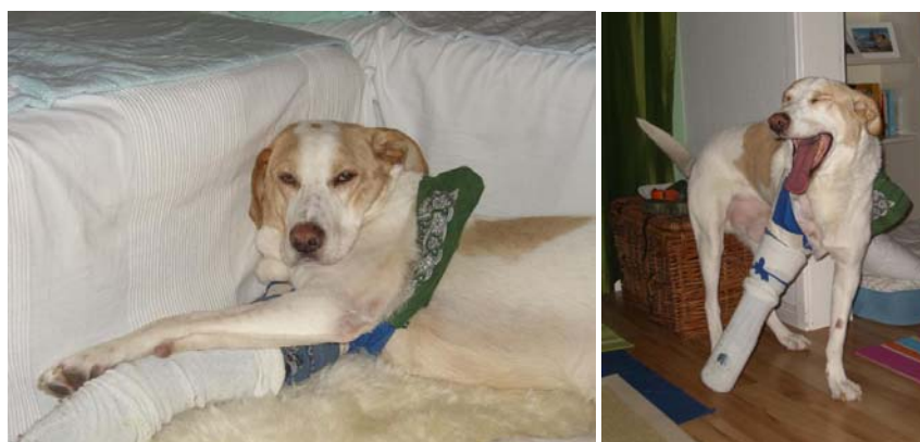
Talismano/Enzo in Deutschland. Mit Gipsbein nach der Operation