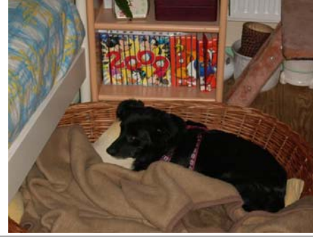
Tappina in Deutschland