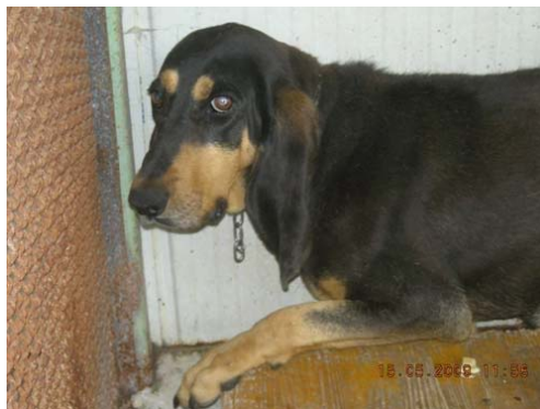
Meo im canile di Rieti