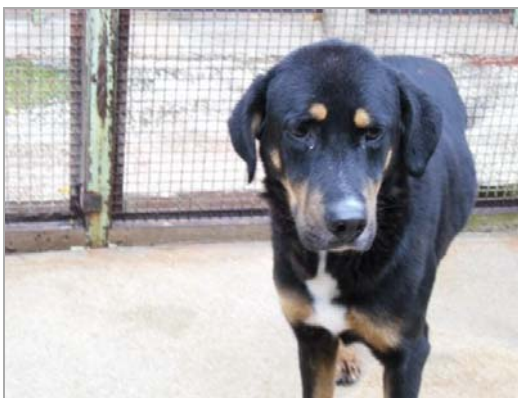
Stoppino im canile di Rieti